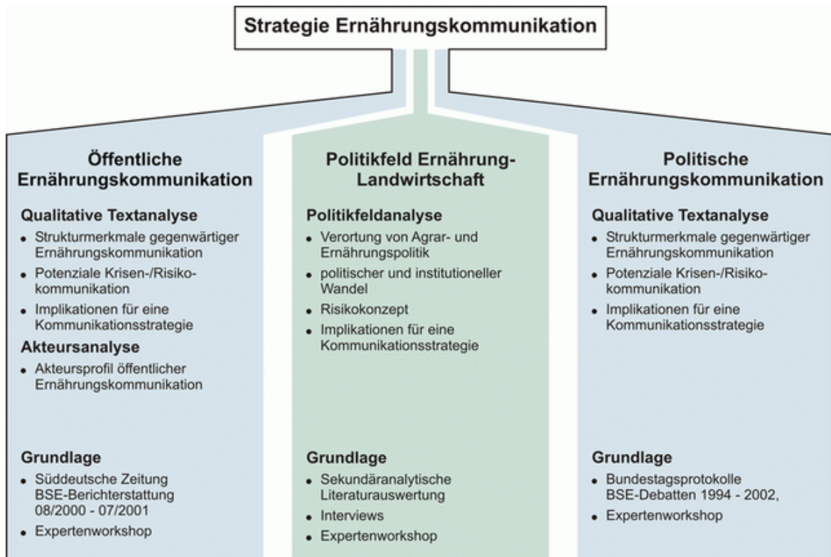
Abbildung 1: Forschungslinien des Moduls Ernährung und Öffentlichkeit

Die Untersuchung der öffentlichen Ernährungskommunikation 1 ist eine von drei Forschungslinien des Moduls Ernährung und Öffentlichkeit . Einen Überblick über die Untersuchungsgegenstände des Gesamtmoduls und ihren Beitrag zur Entwicklung einer Strategie für die Ernährungskommunikation vermittelt Abbildung 1.