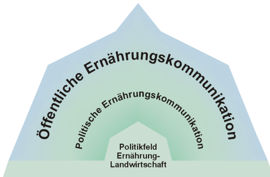
Abbildung 2: Ernährungskommunikation zwischen Politik und Öffentlichkeit

Ein Modell des Zusammenhangs der drei Kompartimente ist in Abbildung 2 dargestellt. Politische Kommunikation hat eine Vermittlerrolle zwischen dem Politikfeld, als Ergebnis vorangegangener politischer Kommunikation, und der Öffentlichkeit. Sie ist sowohl Medium der Konzeption und Veränderung des Politikfelds, als auch Übermittlerin von Impulsen aus dem Politikfeld in die Öffentlichkeit.